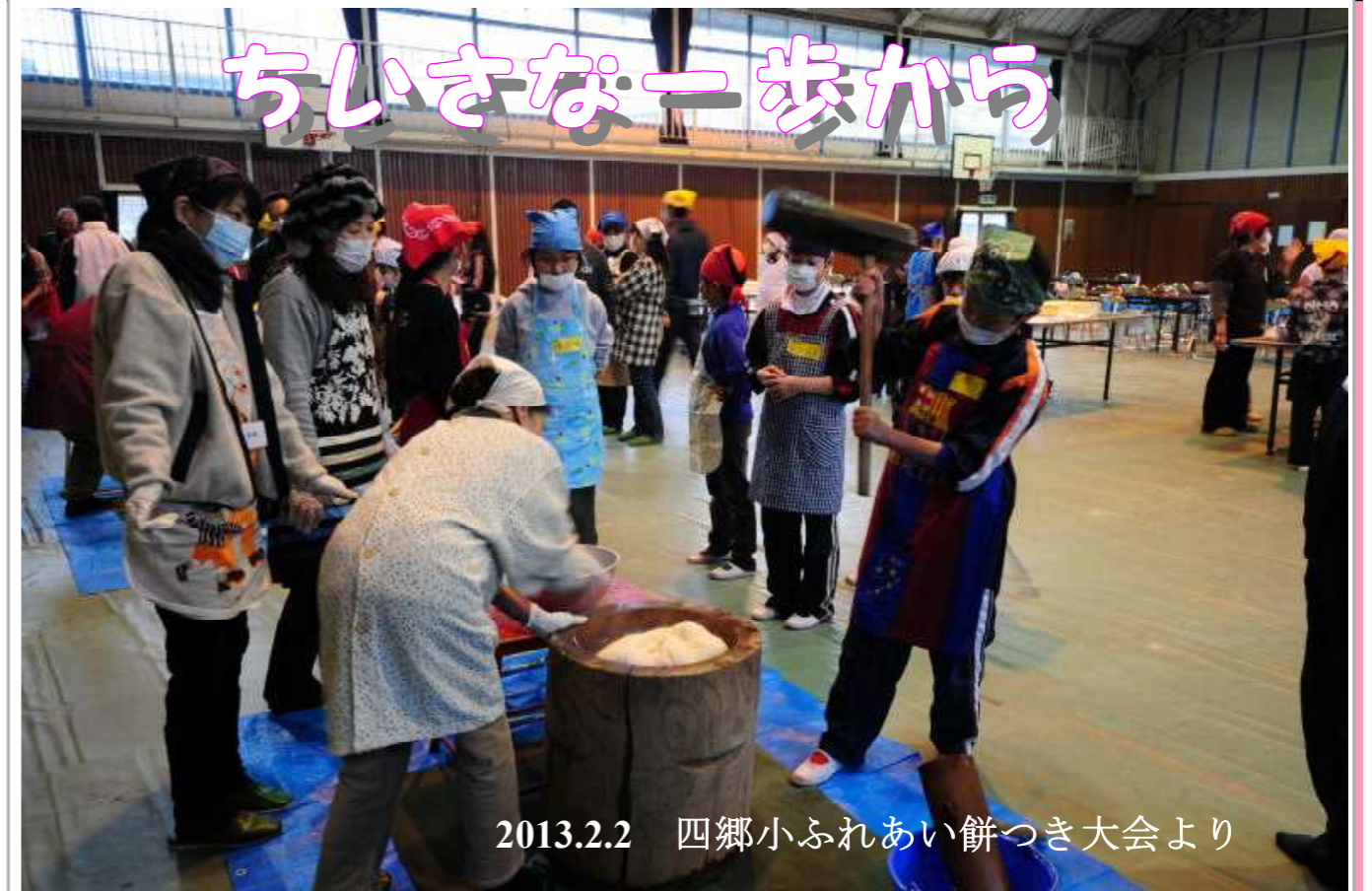
2013.2.2 四郷小ふれあい餅つき大会より