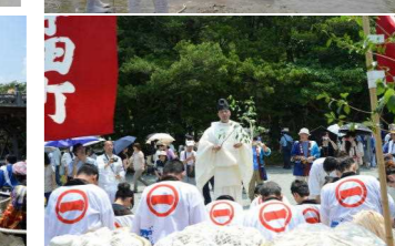
一字田町・緑が丘