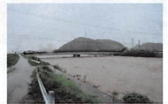
五十鈴川・鹿海町掘割橋付近