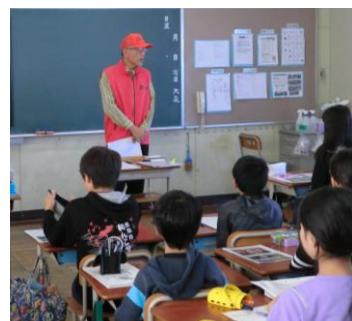
【四郷小6年の教室で】

各地で『 防犯講演会 』を開催 ・六つの自治会で実施し、計二百名余りの方が参加 (生き生き学習委員会)