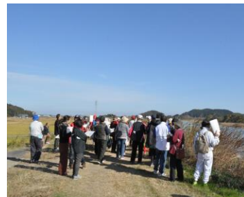
【対岸の鏡宮神社を望んで】