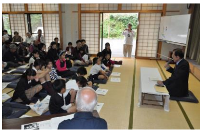
【11/3 朝熊ふれあい会館で】

朝熊町自治会では、町民文化祭に併せて、また、鹿海町では「子どもを守る会」とタイアップしていただいたおかげで、子どもたちも含めて多くの町民の方にご参加いただきました。