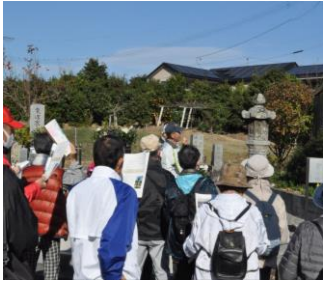
【六地藏石幢の前で】