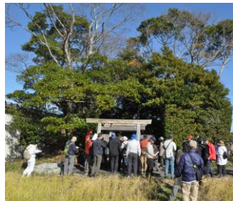
【加努弥(かぬみ)神社前で】