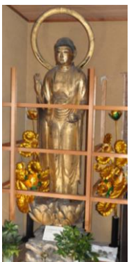
【中村町にある 木造薬師如来立像】

なお、視察に当たっては、当該文化財を所有・管理してみえる皆さんに大変お世話になりました。心よりお礼申し上げます。