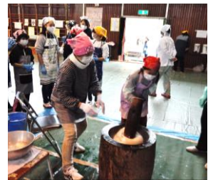
【5,6年生のついたお餅をみんなでおいしくいただきました。】