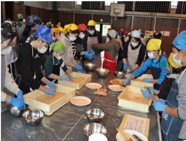
【みんなで きなこ餅をつくりました。】

当日はとても良い天気恵まれ、早朝より地域の方や保護者の方が手伝う中、高学年の子ども達が、伝統行事である餅つきを体験しました。つきあがった餅は、きなこ餅にするなどして、地域の方や低・中学年の子ども達に振舞われました。 六年生の子どもたちにとっては、家族や地域の方と触れ合ったり、他学年の子ども達との交流を深めたりして、小学校生活の楽しい思い出になったことと思います。