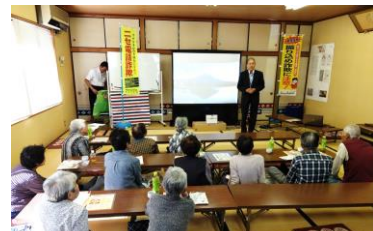
【10/15 一宇田町公民館で】

『 四郷地区防災講演会 』を開催 ・二〇二〇年二月九日(日)に四郷地区「コミュニティセンター」で実施 ・参加者 三十八名 (住み良い暮らし委員会)