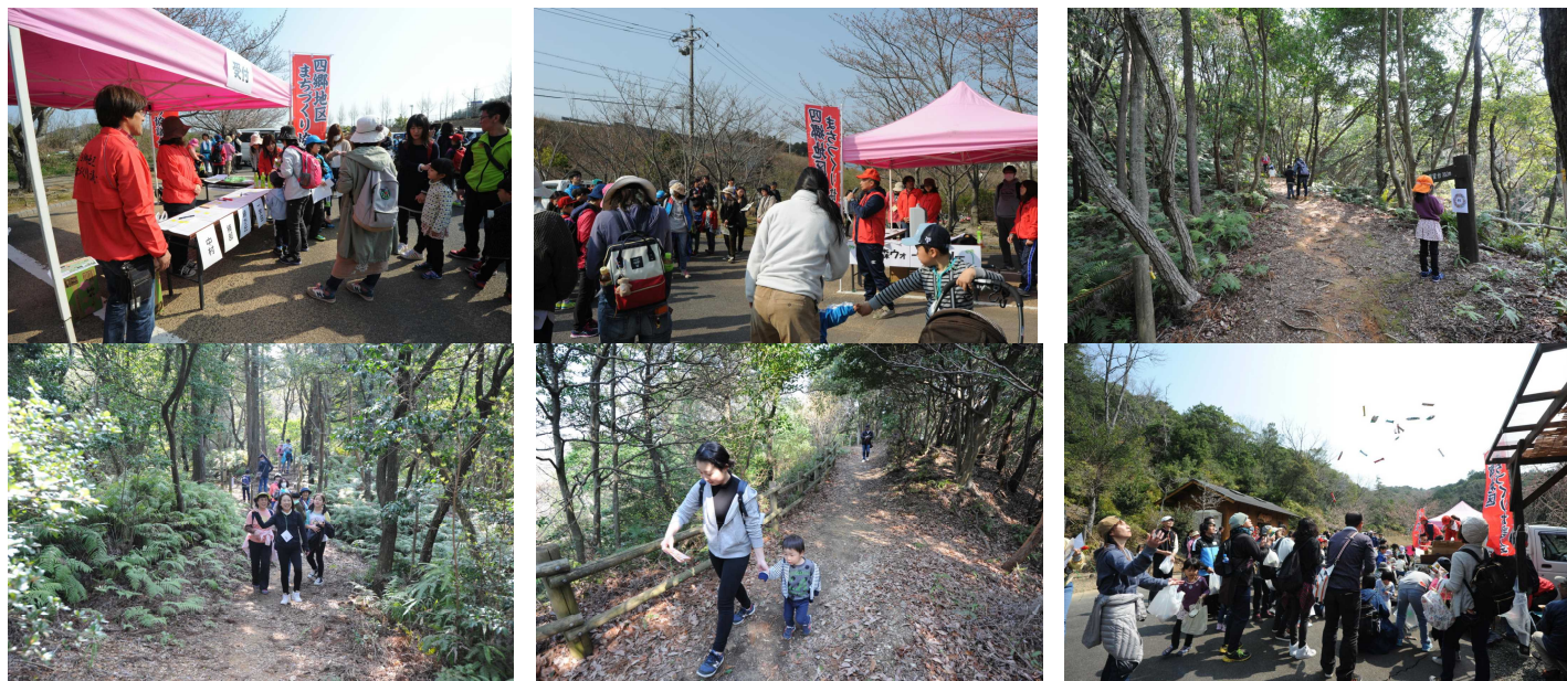
今回は、朝熊町委員会の皆さんのご協力で「木工教室」を開設しました。