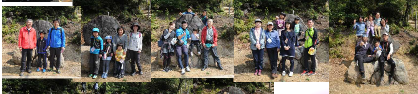
三世代で参加の皆さん