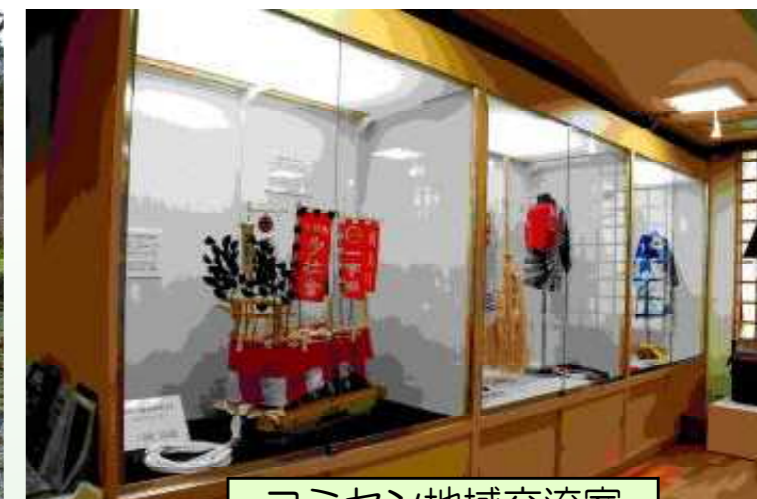
コミセン地域交流室