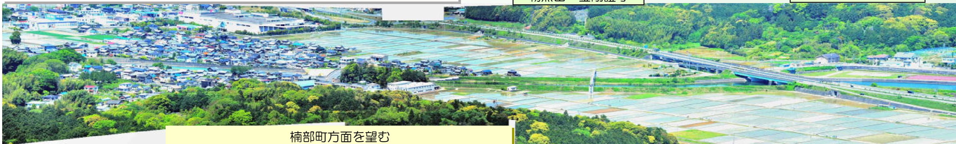
楠部町方面を望む