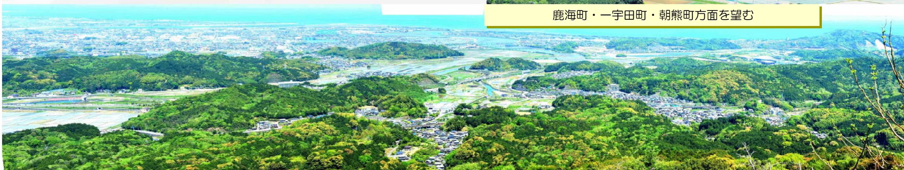
鹿海町・一字田町・朝熊町方面を望む