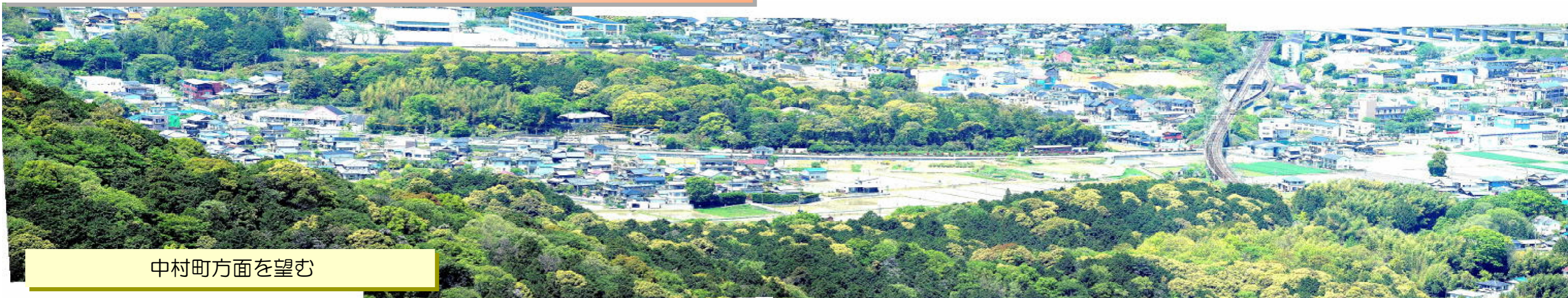
中村町方面を望む