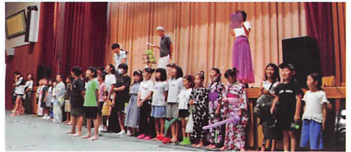
「校歌歌うよ。」と、校長先生の呼び掛けで集まった子どもたち