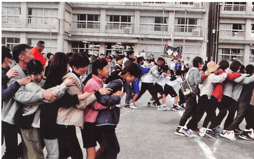
大熱戦となった町別対抗のムカデ競争

小学校の運動会に引き続き、町民運動会が行われましたが、90代女性の方が50メートル走を完走されたり、人数制限のため、大玉転がしに出られなくて泣き出す子がいたり、いろいろなことがありました。中でも、ムカデ競争など町別対抗競技では一層の盛り上がりを見せ、皆さん楽しんでいただきました。