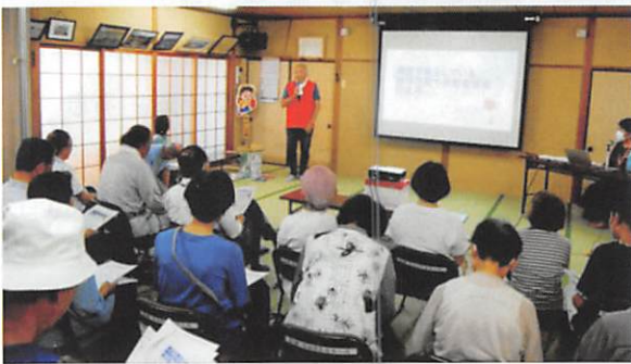
鹿海町での防犯講演会

どんな形であれ、防犯講演会や啓発を繰り返して行うことや、お互い声を掛け合ったりすることで、少しでも被害防止に努めたいものです。