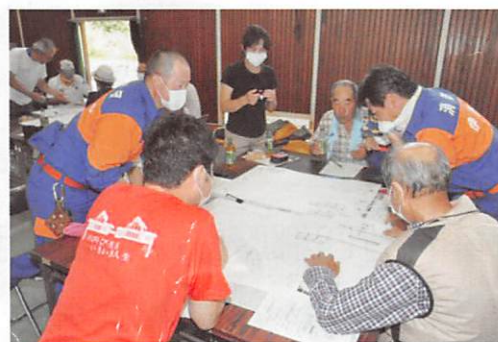
避難所運営について熱心に話し合う参加者の皆さん

【HUG(ハグ)とは】 『避難所・運営・ゲーム』の頭文字をとって「HUG(ハグ)」と読みます。避難者の情報やイベントなどが書かれたカードを使用し、避難所運営を疑似体験できるゲームです。