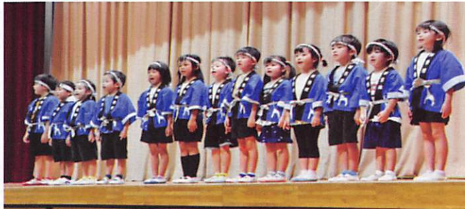
かわいい歌声を元気よく、しごうこども園の園児たち

納涼祭のあった7月29日(土)は真夏日で、会場の四郷小体育館は大変な暑さでした。そんな中 350名の方がご参加いただき、暑ささえ吹き飛ばすほどの盛り上がりを見せ、楽しい納涼祭となりました。