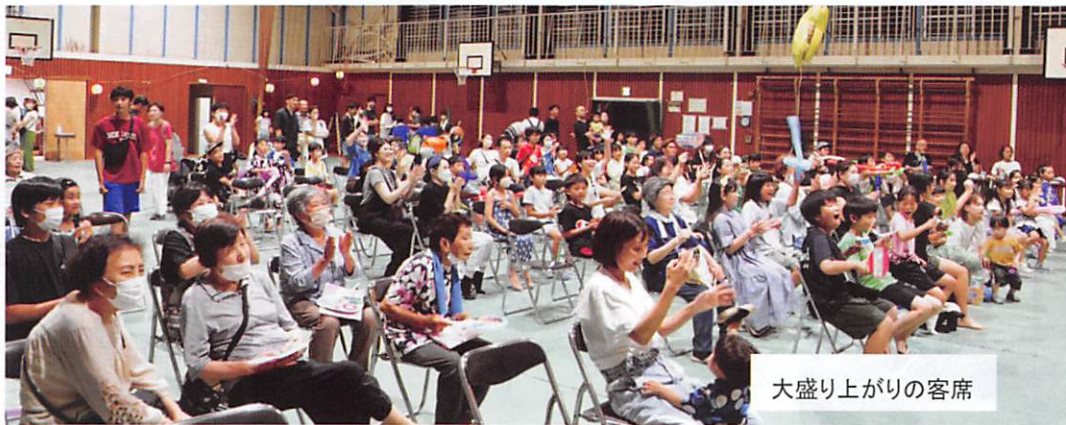
大盛り上がりの客席