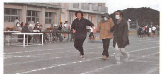
まだまだお元気です