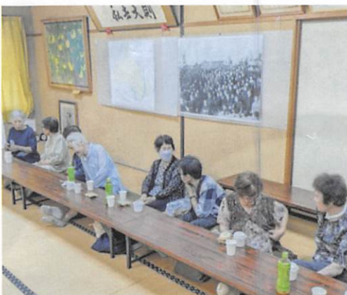
おしゃべりタイムで楽しいひと時を

今後とも、この「ふれあい出前カフェ事業」を多くの自治会で取り入れていただき、高齢者同士のふれあいの場を設けていただければ、幸いです。